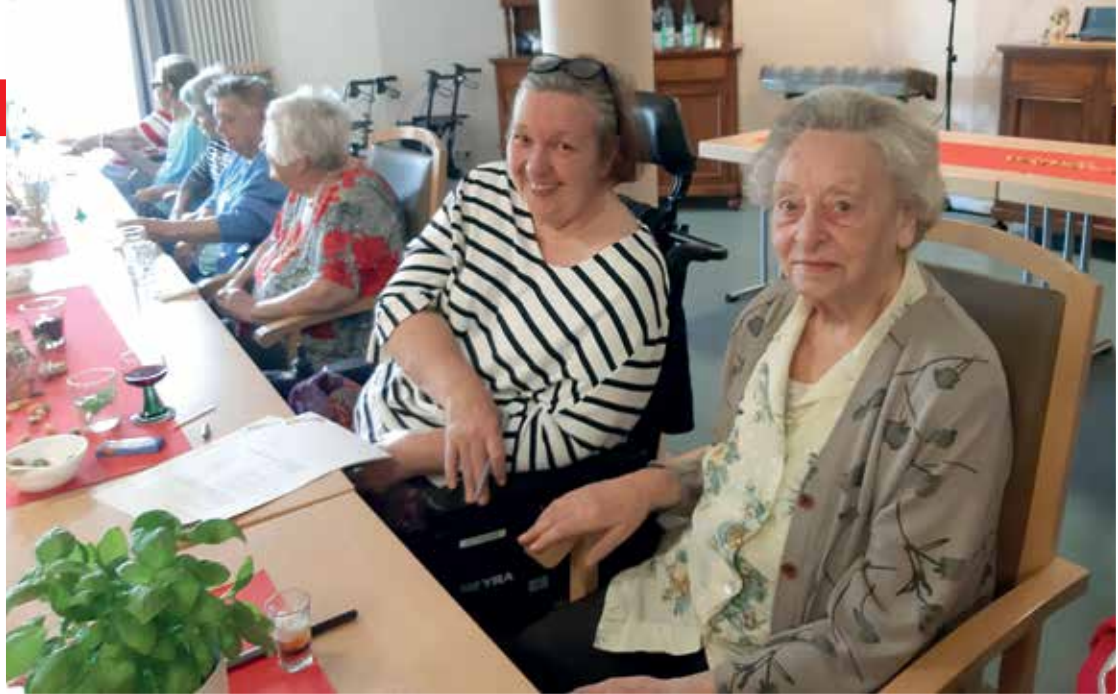
Bella Italia hielt im Juni Einzug an der Hären- wies