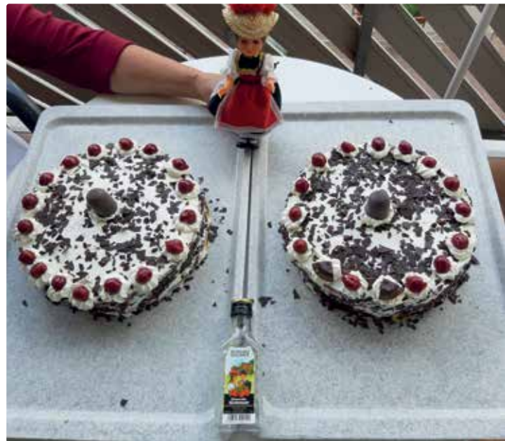
Monis Schwarzwaldnachmittag auf WB1

Der Betriebsrat lud im Herbst zu Zwiebelkuchen und Federweißem ein.