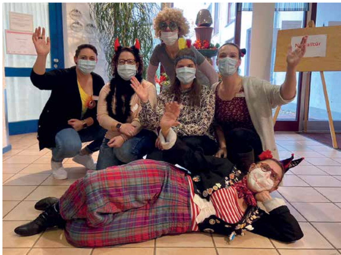
Frei nach unserem Karnevalslied: Heile, heile Mause- speck – irgendwann ist auch Corona weg!

Ein wirkliches Lächeln erkennt man eben nicht nur am Mund sondern vor allem an den Augen! Hier ein anschauliches Beispiel unserer Pflege- kräfte von WB2