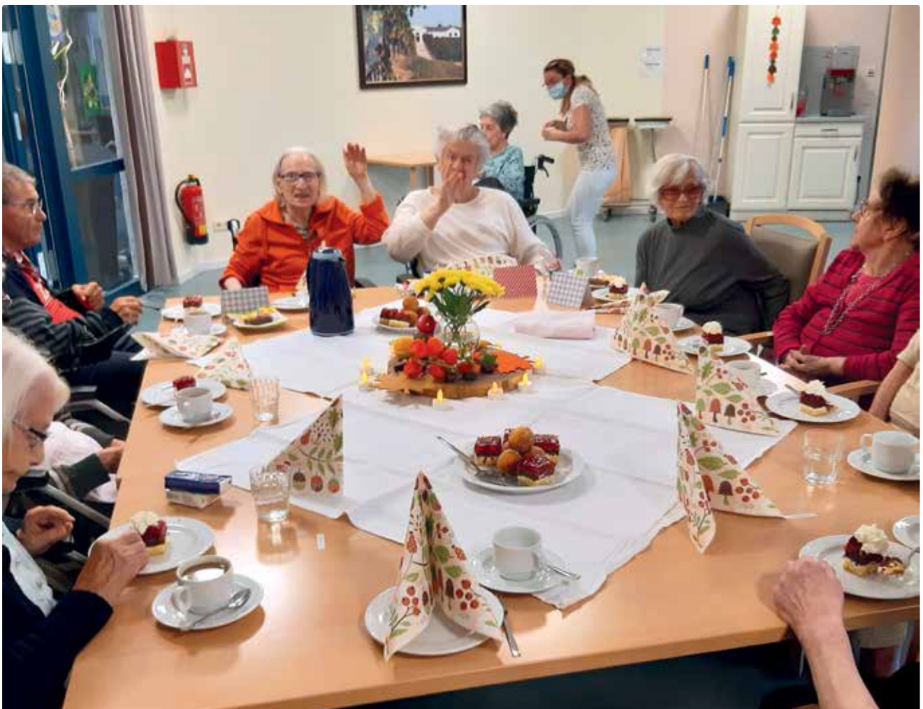
Im kleinen Kreise Geburtstag feiern – das ging auch mit Corona!

Der Betriebsrat lud im Herbst zu Zwiebelkuchen und Federweißem ein.